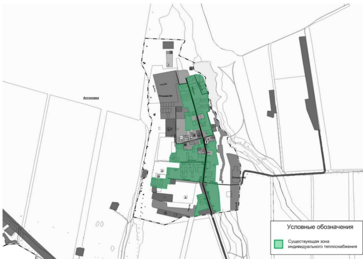
Рисунок 2.2.1 – Существующие зоны действия индивидуальных источников тепловой энергии п. Антоновка