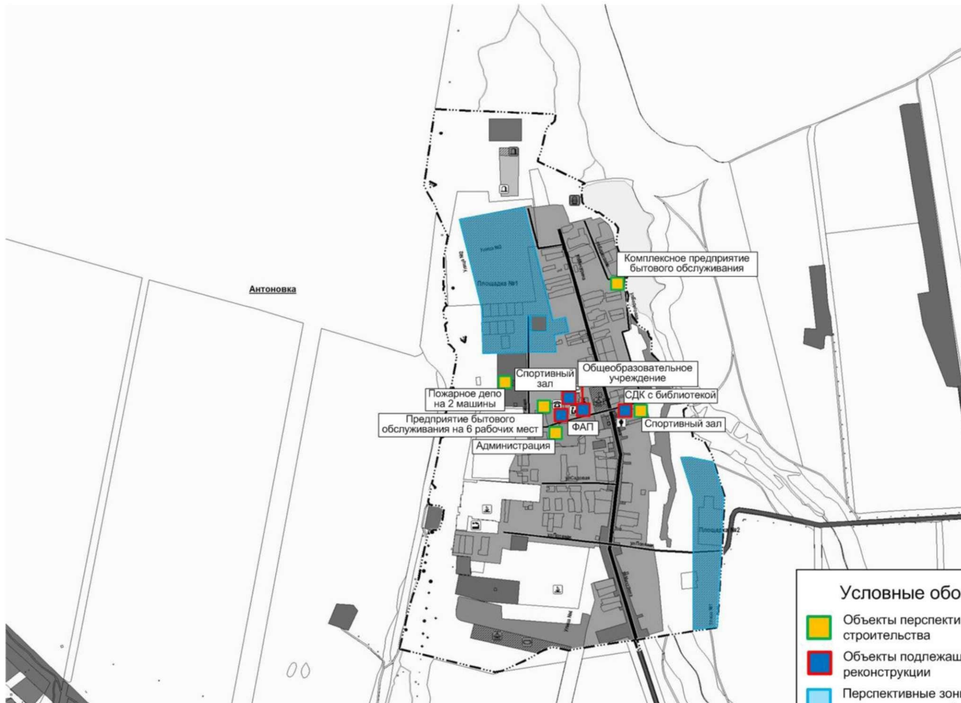
Рисунок 1.1.1 – Территория п. Антоновка с площадками под жилую зону и выделенными объектами перспективного строительства и реконструкции